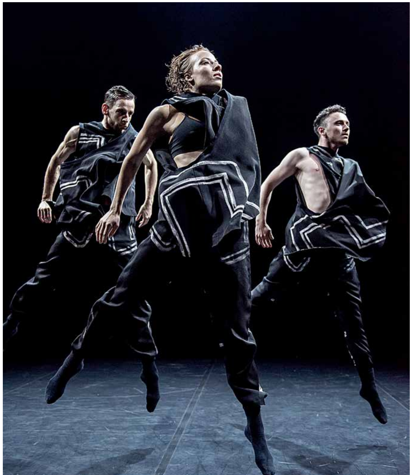
"KRASH & Chopin Danser", to forestillinger i Flensborg lørdag aften den 16. februar.