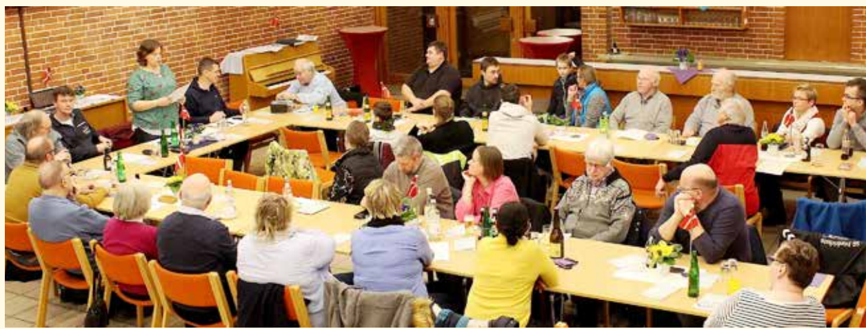
Der var pænt fremmøde til generalforsamlingen.