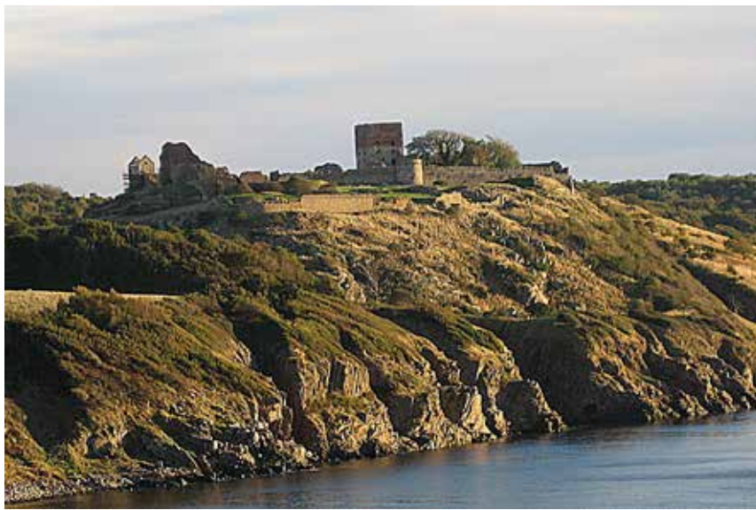
Der er et betagende sceneri ved Hammershus.