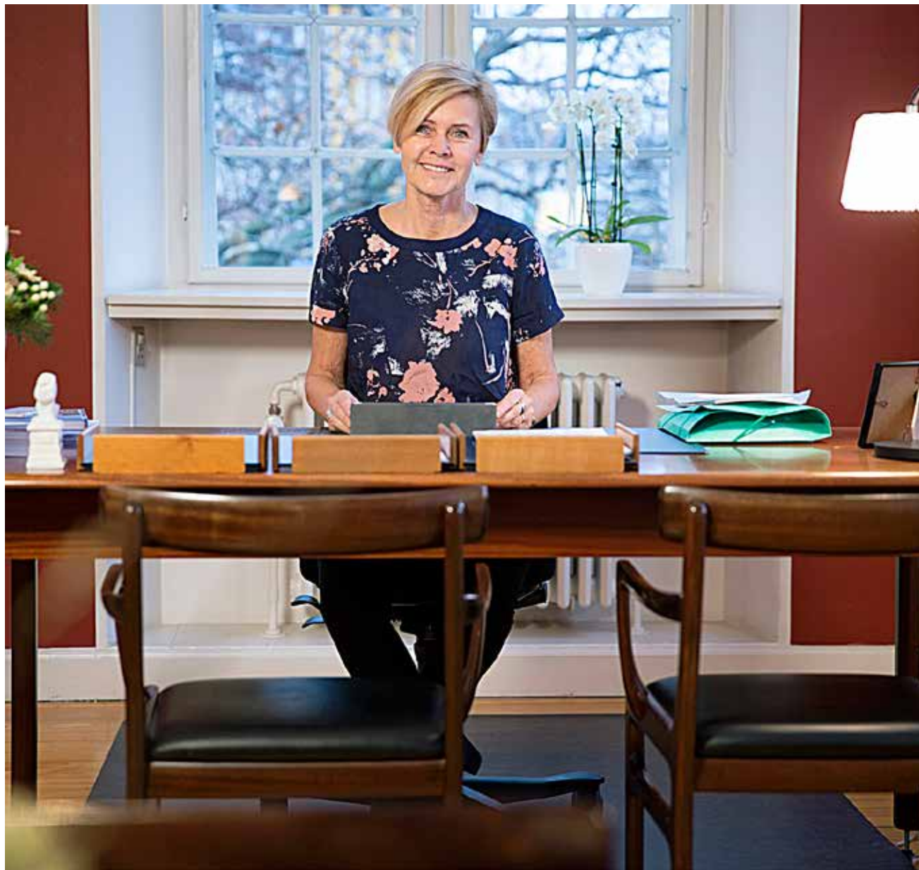
Kultur- og kirkeminister Mette Bock.