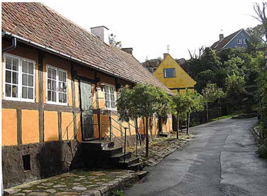
I Gudhjem er nogle af gaderne så stejle, at det er forbudt at cykle.