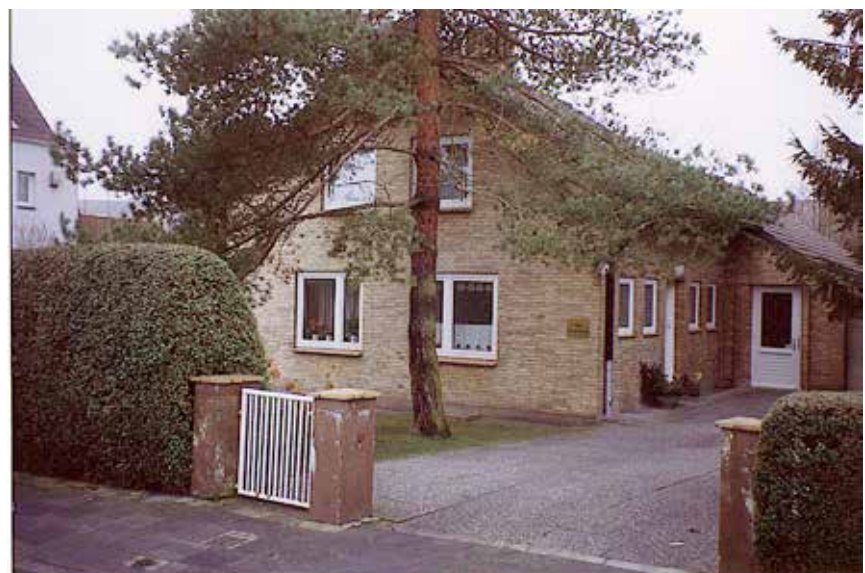
Holtenå Forsamlingshus er skønt beliggende midt i et villakvarter i Kiel-bydelen Holtenå og centrum for det danske arbejde dér.