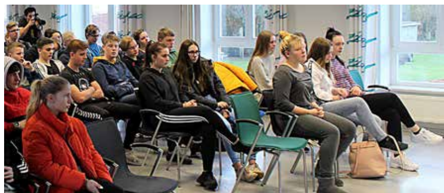
Eleverne på Husum Danske Skole hørte ikke blot andægtigt efter. De spurgte og diskuterede engageret.