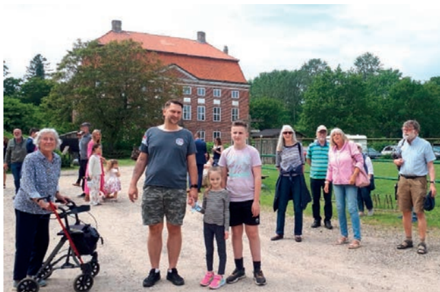
Tur i det blå

I maj var der tid til en tur ud i det blå, gennem vores dejlige landskab i Jernved og Svansø. Målet var Ludwigsborg Gods.