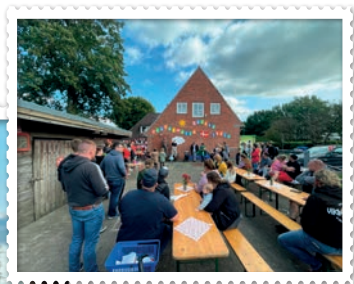
Billeder fra sommerfesten