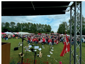
Årsmøde 8. juni