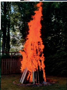
Sankt Hans 28. juni