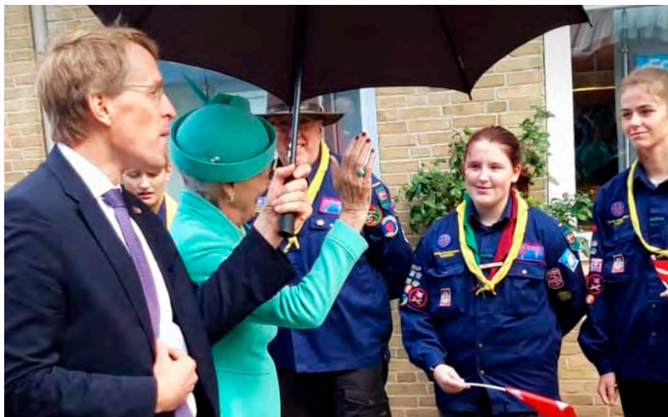
Rendsborg spejdernes møde med Dronningen og Ministerpræsident Daniel Günther i Frederiksstad.