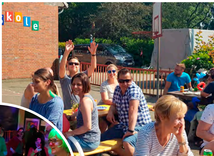
Sommerfest og fastelavn